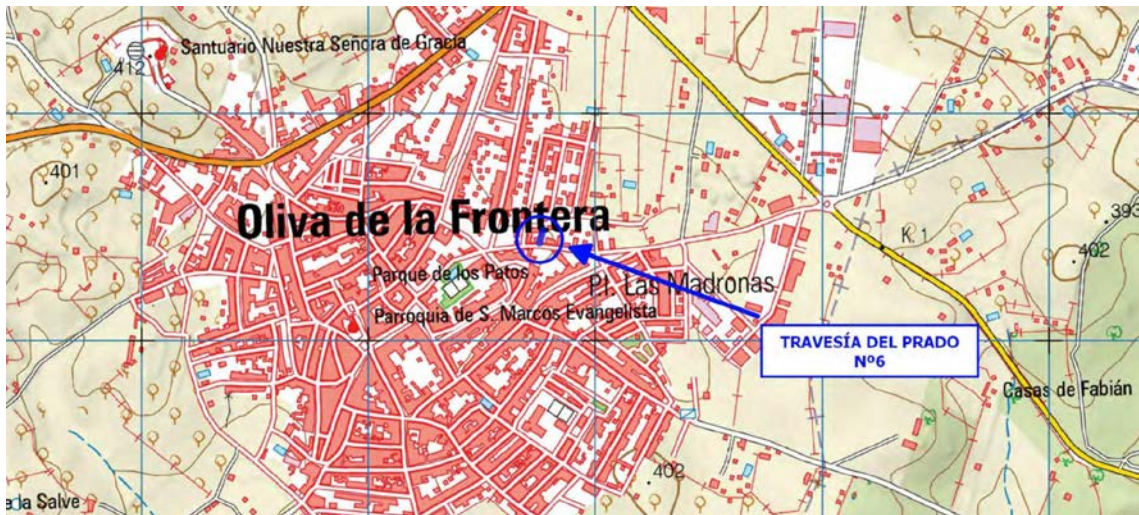
Figura 1: Ubicación

La parcela catastral ocupa una superficie de 261 m 2 , de los que se emplearán unos 96 m 2 para el desarrollo de la actividad. Además de la superficie de almacenamiento, se dispondrá de una zona de descarga en la entrada a las instalaciones. Esta zona de descarga tiene una superficie de 13,00 m 2 . El resto de superficie se empleará para el almacenamiento de los residuos.